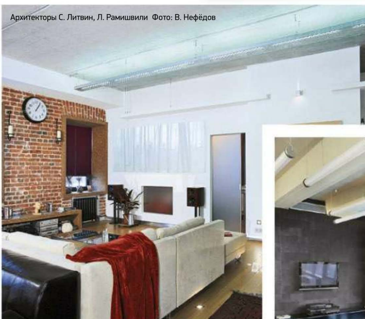
Архитекторы С. Литвин, Л. Рамишвили

Открытая кирпичная кладка, испытанная временем, и массивные деревянные балки под потолком придают этому интерьеру особый колорит. Входная зона отделена от гостиной специально возведённой перегородкой, не достигающей потолка, — принцип организации открытого лофтового пространства не нарушен, а лишь немного трансформирован ради большего комфорта