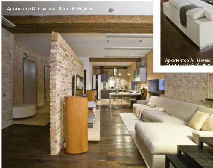
Архитектор И. Якушина

Панорамное остекление и ахроматическая гамма, строгие формы, открытые конструкции потолка и «промышленное» освещение — классические приметы лофта